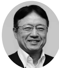
福岡市環境局長 星子 明夫

福岡市では、人と地球にやさしい持続可能な都市の構築を目指して再生可能エネルギーの導入や省エネルギーの推進など、さまざまな排出抑制やリサイクルを推進するための様々な施策を展開しております。 ごみ問題については、循環型社会構築のためのリデュース・発生抑制・リユース・再使用・リサイクルの5R（5R）の推進によりごみ減量リサイクルに取り組んでまいりま