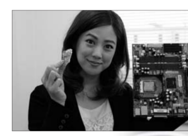
レポート 北出 恭子

小型家電は、貴金属やレアメタルの宝庫 市内の回収ボックスに集められた使用済小型家電は、北九州市若松区のエコタウンにある日本磁気選鉱株式会社に運ばれ、レアメタル・貴金属濃縮回収ラインで破碎・選別・回収を行っています。 まず、集められた小型家電やIC基板は1次破碎工程で、レアメタルや貴金属を含んだ濃縮物と、鉄、アルミなどを選別。続いて2次破碎工程で、1次破碎工程で分別した濃縮物からプラスチック類などを取り除き、レアメタル・貴金属の純度を高めます。 高い濃縮物にしていき、レアメタルや貴金属は電子部品に使用され、「電子回路基板」にはんだ付けで実装されているものがほとんど。このため電子部品と基板を効率よく分離させる技術が必須になります。 要になりますが、2次破碎工程では、基板からICチップのみを剥ぎ取る独自開発の「RIM」破碎機を投入。これにより、ひとさきわ高純度の濃縮物を容易に取り出し、レアメタル回収率95%以上を実現するとともに、手解体の不要、大量処理をこなしています。