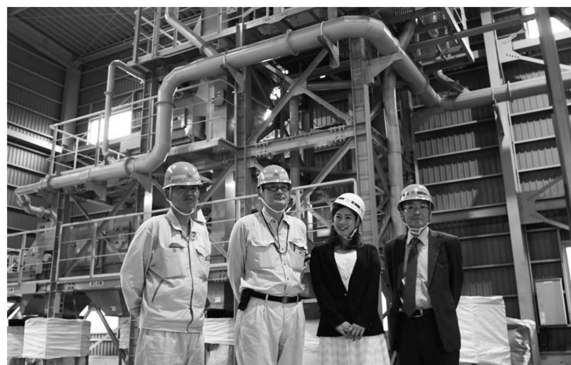
左より、古郷生産部長、辻工場長、レポート北出、営業部江藤課長